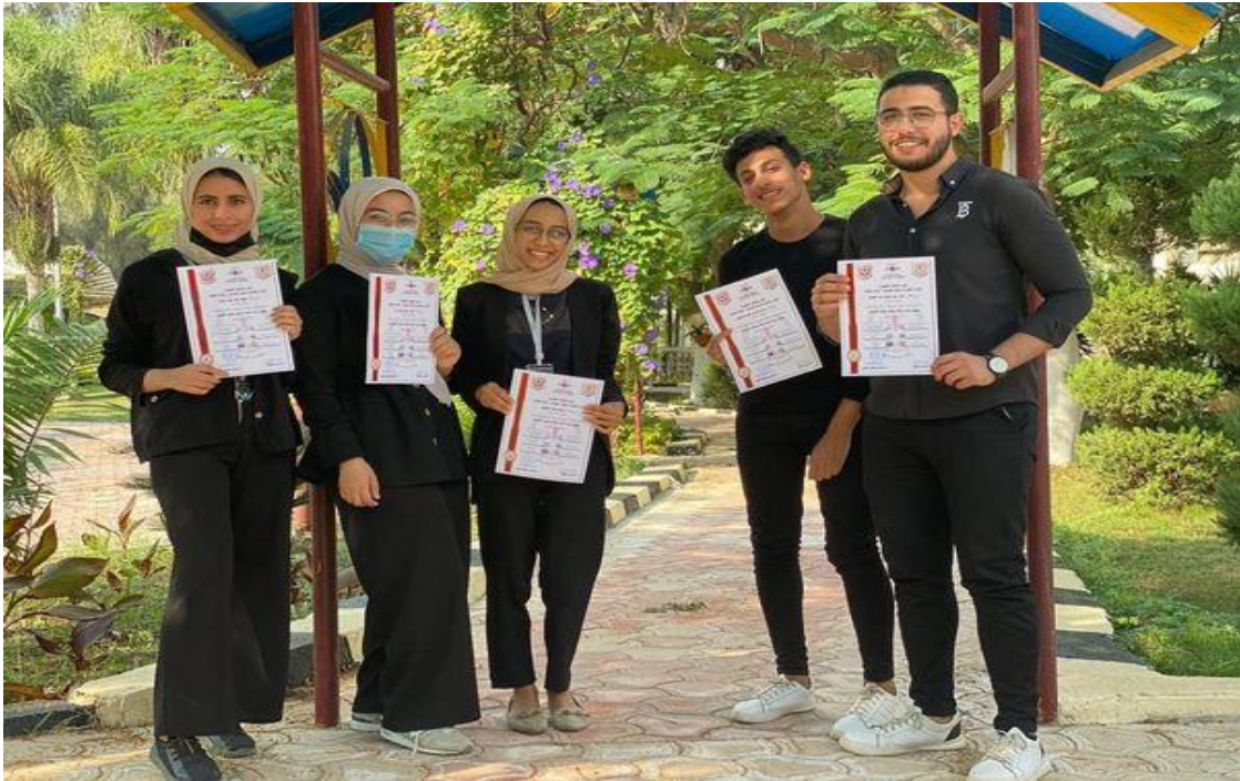
دورة إعداد القادة