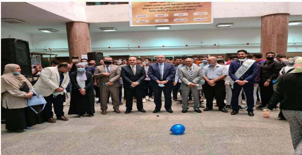
حفل استقبال الطلاب الجدد والقدامى للعام الجامعي ٢٠٢٢/٢٠٢١