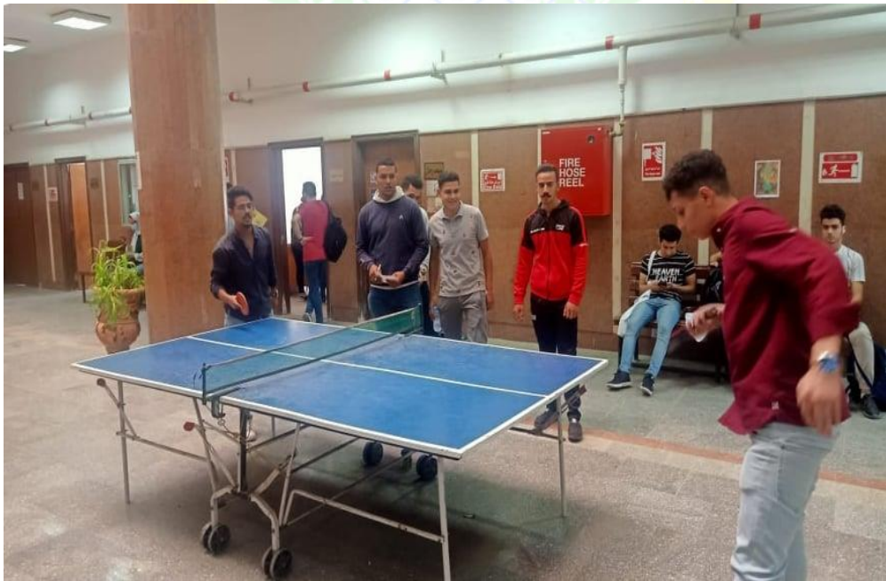
مسابقة تنس طاولة