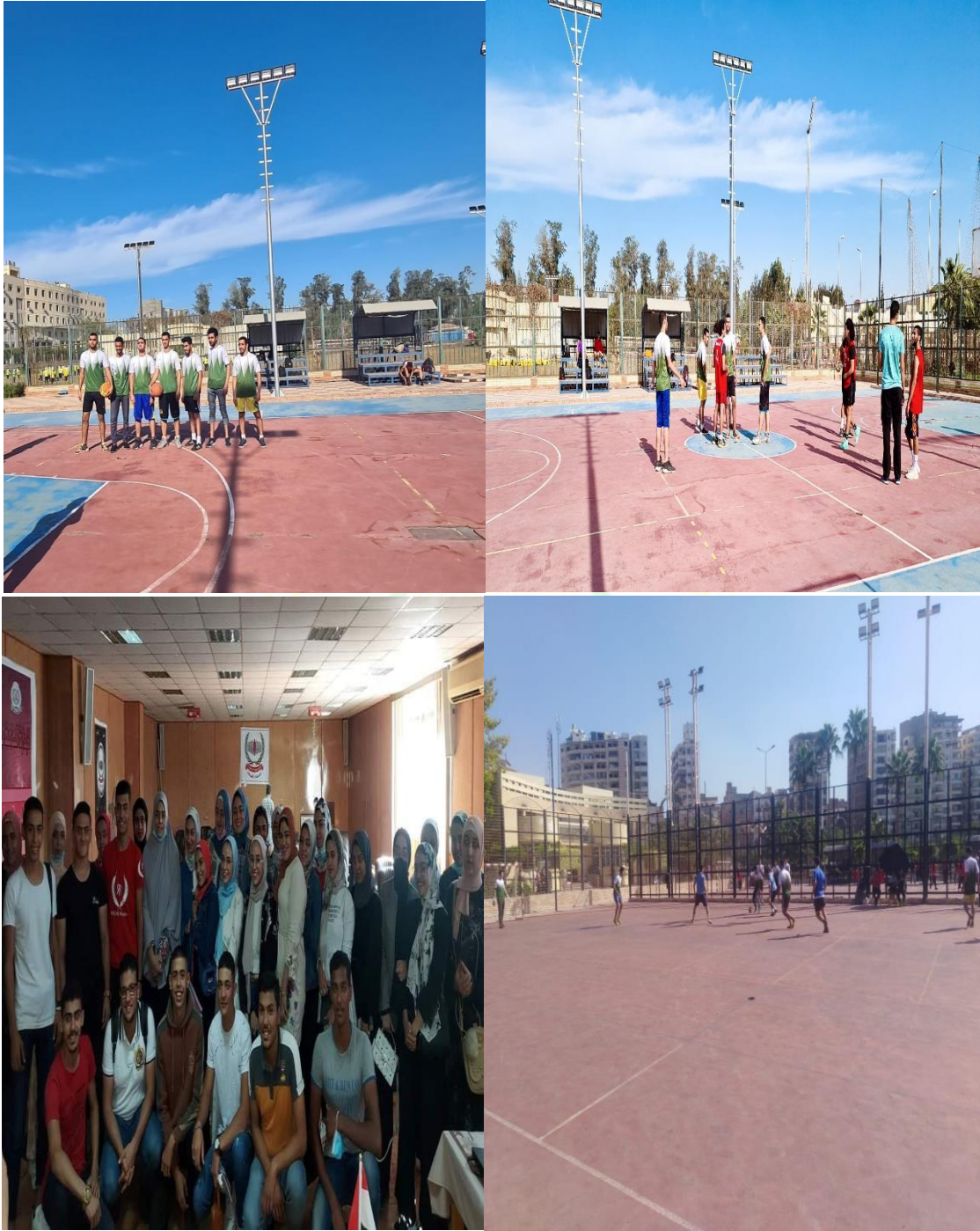
خماسي كرة قدم