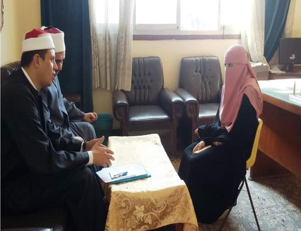
مسابقة القرآن الكريم