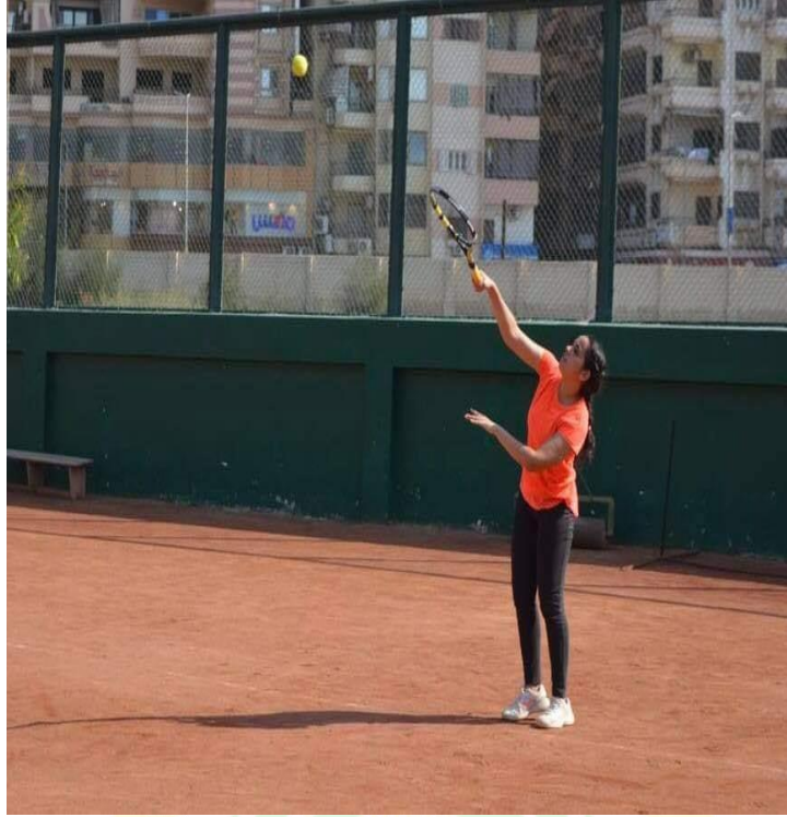
بطولة التنس الأرضي