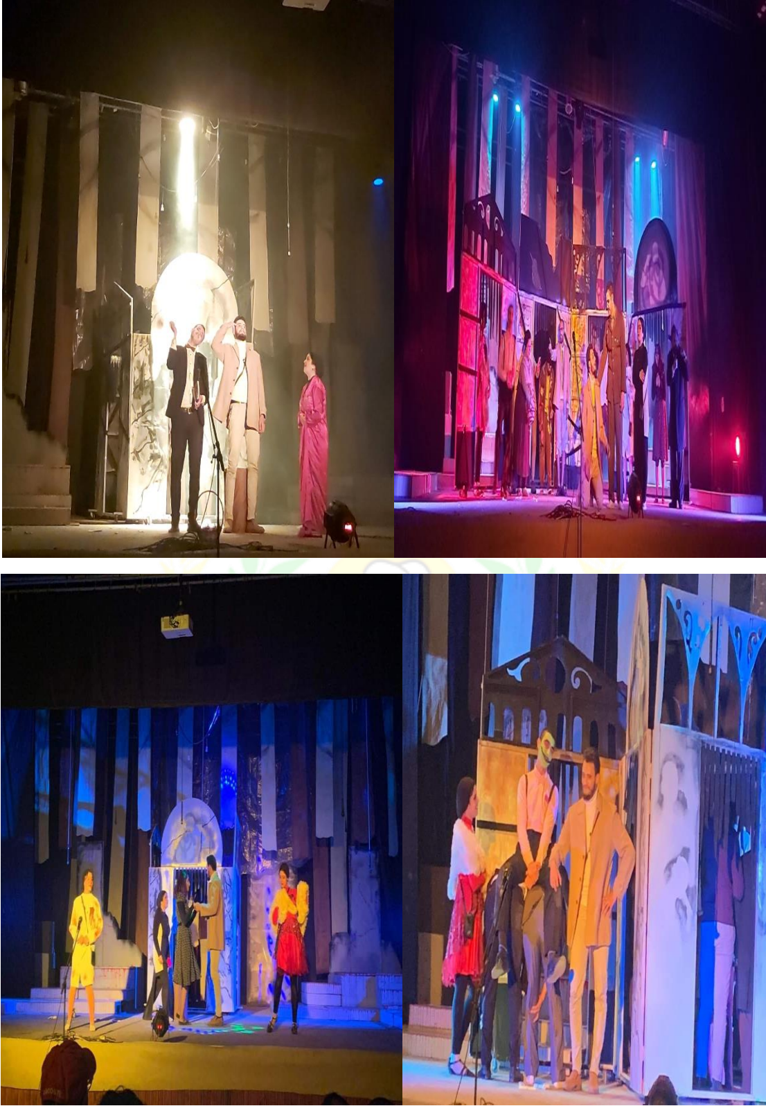
المهرجان المسرحي الطلابي