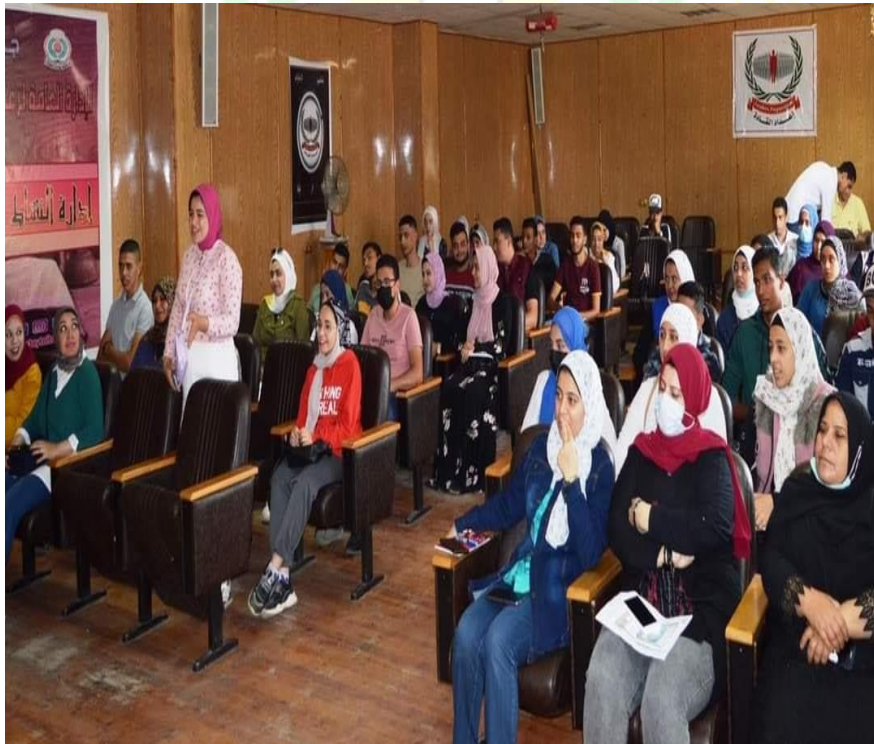
دورة تدريبية للطلاب في إعداد القادة