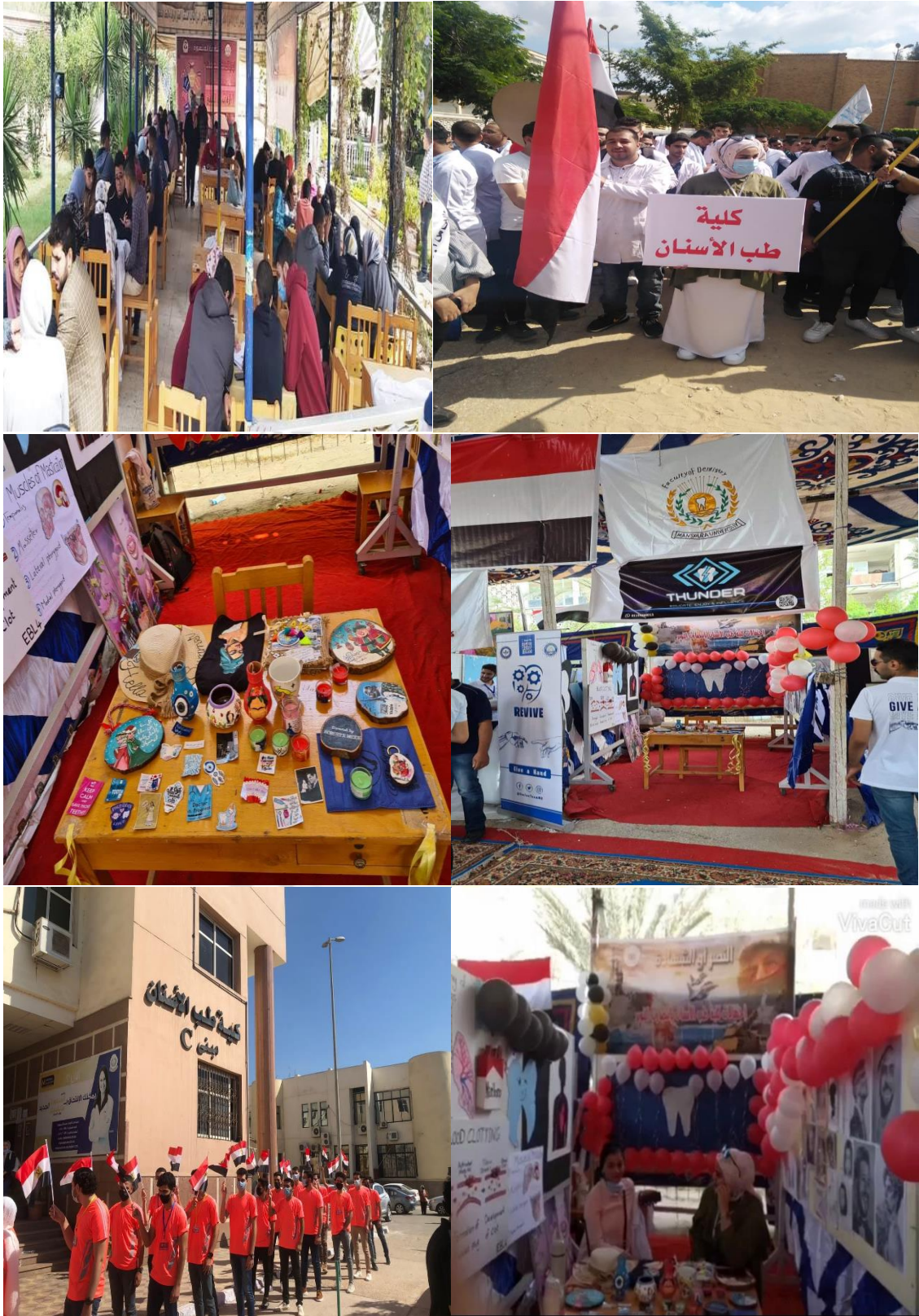
مهرجان الأسر الطلابية